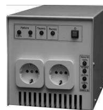
SinPro™ 200 - S910