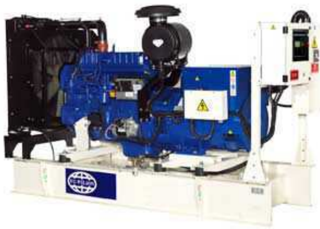
Рисунок приведен исключительно с иллюстративной целью