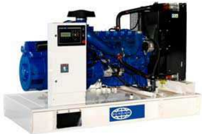
Рисунок приведен исключительно с иллюстративной целью