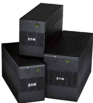
ИБП серии 5E