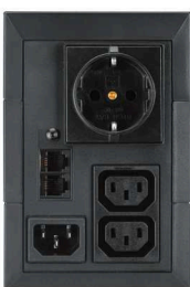
ИБП 5E 650 USB DIN