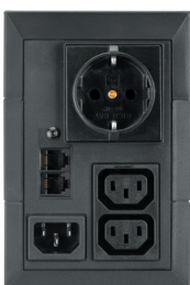
ИБП 5E 650 USB DIN