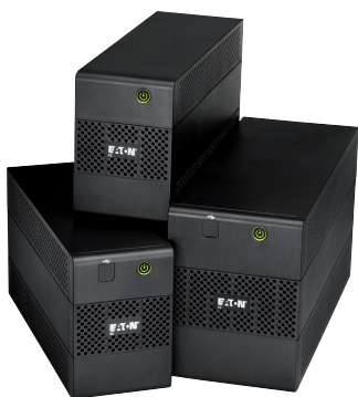
ИБП серии 5E