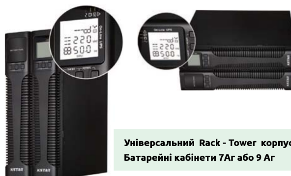
Універсальний Rack - Tower корпус Батарейні кабінети 7Ag або 9 Ag