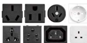
Опціональні вихідні розетки