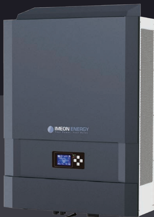
IMEON 9.12 Трифазне рішення