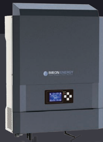
IMEON 3.6 Однофазне рішення