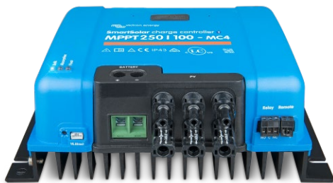
Контроллер заряда SmartSolar MPPT 150/100-MC4 без экрана