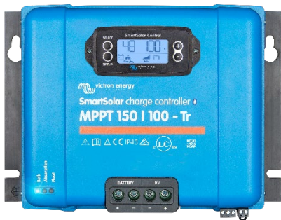
Контроллер заряда SmartSolar MPPT 150/100-Tr с опциональным подключаемым экраном