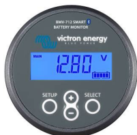
Bluetooth считывание: BMV-712 Smart Battery Monitor