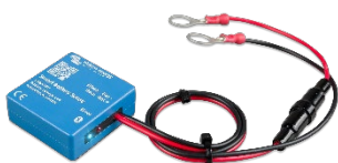
Bluetooth считывание: Smart Battery Sense