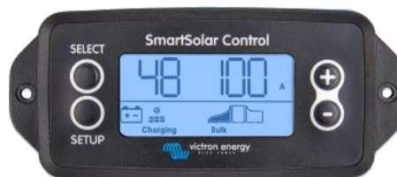
SmartSolar pluggable display

Просто снимите резиновую заглушку, которая закрывает разъем спереди контроллера и вставьте кабель монитора.