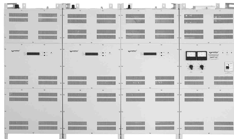
Рис. 1. Стабилизатор напряжения

Блоки стабилизатора состоят из 3-х отсеков. Для крепления к стене каждый блок имеет специальные петли в верхней части. Для крепления к полу используются отверстия в ножках блоков.